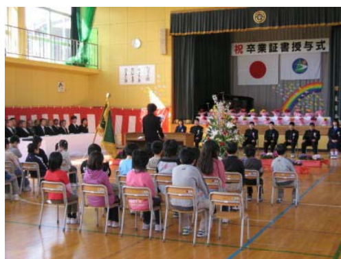
凛々しい姿の9名の鼓小っ子たち。

「胎内市認定農業者会」より卒業生にチューリップの花が贈呈されました。今年度は、卒業式の中で、1年生と2年生が一人一人に手渡しました。卒業生と在校生全員でつくり上げた卒業式をすてきな黄色いチューリップの花がひきたててくれました。保護者の方々や職員と一緒に撮った写真の笑顔が心に残ります。