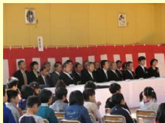
来賓の皆様が見守ります。