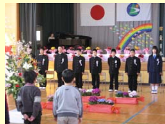
今年の門出の言葉は、卒業生も在校生も全員が主役。立派に役割を果たしました。