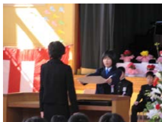
凛々とした態度でした。

保護者の皆様、地域の皆様からは心強い学校へのご理解とご協力をいただきました。また、子どもたちへの惜しみない愛情と支援をいただきました。感謝申し上げます。平成21年度も職員一同、子どもの笑顔いっぱい花いっぱいの学校づくりに努めます。