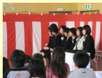
保護者の皆様のあたたかなまなざし。