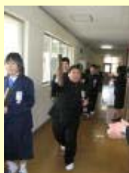
卒業証書を手に入在校生とお別れ。