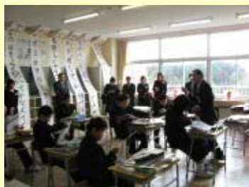
卒業式後の教室での一コマです。